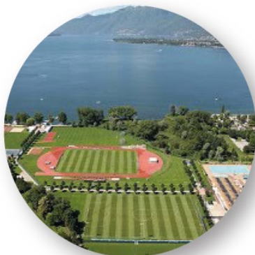
Sporttage, Tenero Sportlager