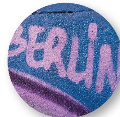
Studienreise ins Ausland, 3. Jahr