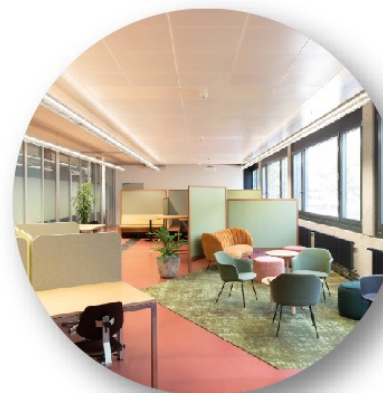
Lernatelier mit Fachkursen und Lerncoaching; selbstorganisiertes Lernen